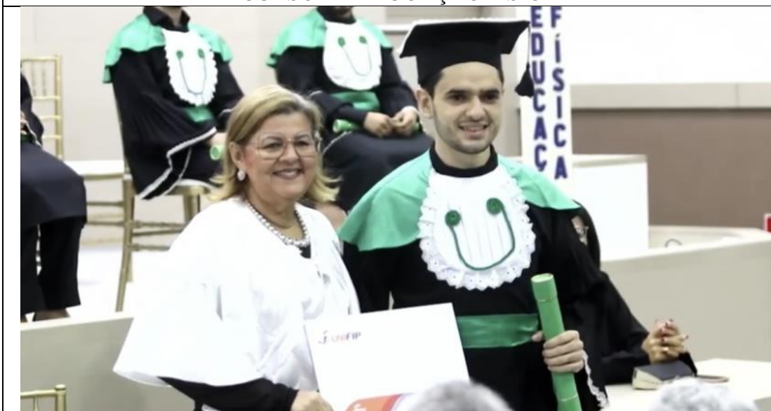
ENTREGUE PELA VICE – REITORA DO UNIFIP