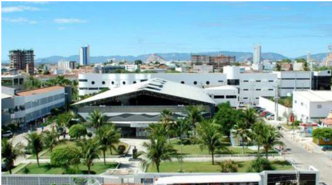
Vista aérea do UNIFIP

Estando sempre em busca do aprimoramento de suas ações, sejam elas direcionadas ao ensino, pesquisa ou extensão, com relação à Infraestrutura Física é evidente como o Centro Universitário de Patos [UNIFIP] ao longo desses 59 anos de existência, vêm se esforçando no sentido de atender todas as demandas dos 18 [dezoito] cursos de Graduação.